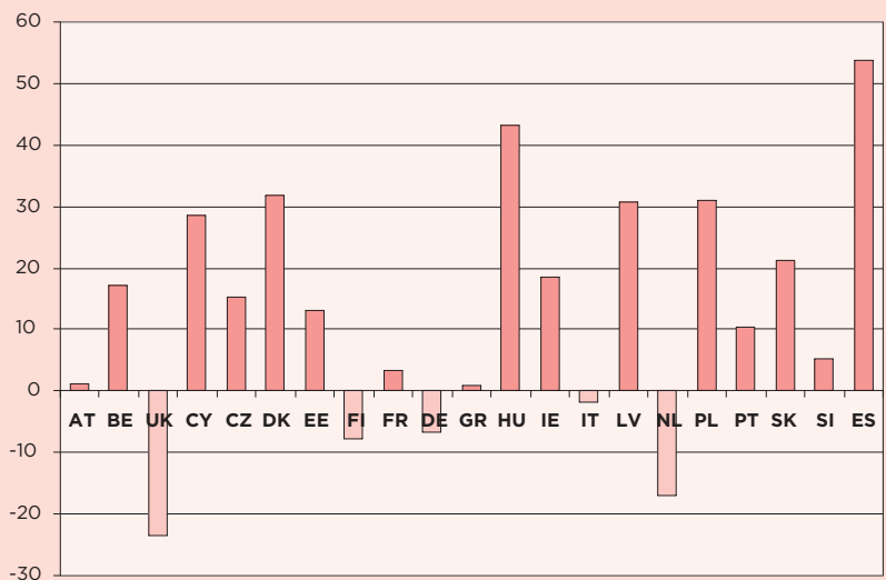
Gráfico 2. Satisfacción con el funcionamiento de la democracia en la UE*

Texto de la pregunta: En general, ¿diría Vd. que está muy satisfecho, bastante satisfecho, poco satisfecho o nada satisfecho con el funcionamiento de la democracia en la Unión Europea?