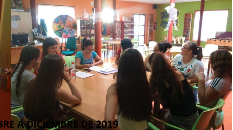
ACTIVIDADES DE OCTUBRE A DICIEMBRE DE 2019